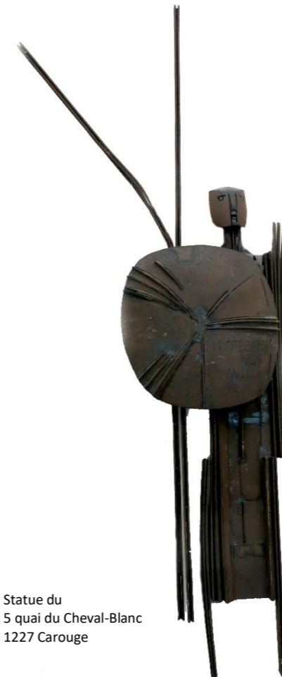
Statue du 5 quai du Cheval-Blanc 1227 Carouge