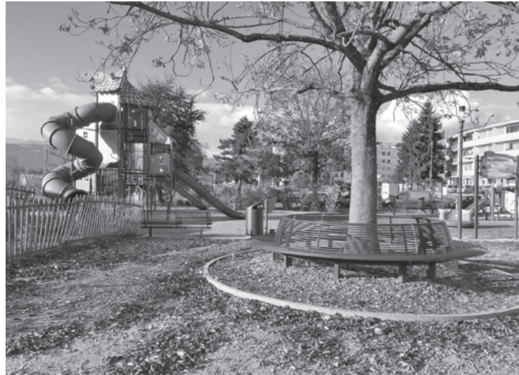
VISITE DU PARC DE JEUX DES LIBELLULES

et du souci que le nouveau quartier permette un bien vivre ensemble, nous rencontrons régulièrement les différents partenaires (départements de la Ville et du Canton concernés, le consortium du projet et certaines autres associations futures occupantes des lieux). Si l'AAA a pu s'exprimer sur le cahier des charges général du projet d'aménagement, elle s'implique afin de poursuivre cette démarche pour les cahiers des charges à venir concernant notamment les aménagements extérieurs du quartier. La superposition entre le futur préau de l'école et une place centrale du quartier va être un enjeu majeur, ainsi que les aménagements des cours intérieurs, pour qu'elles puissent être des lieux de vie qui